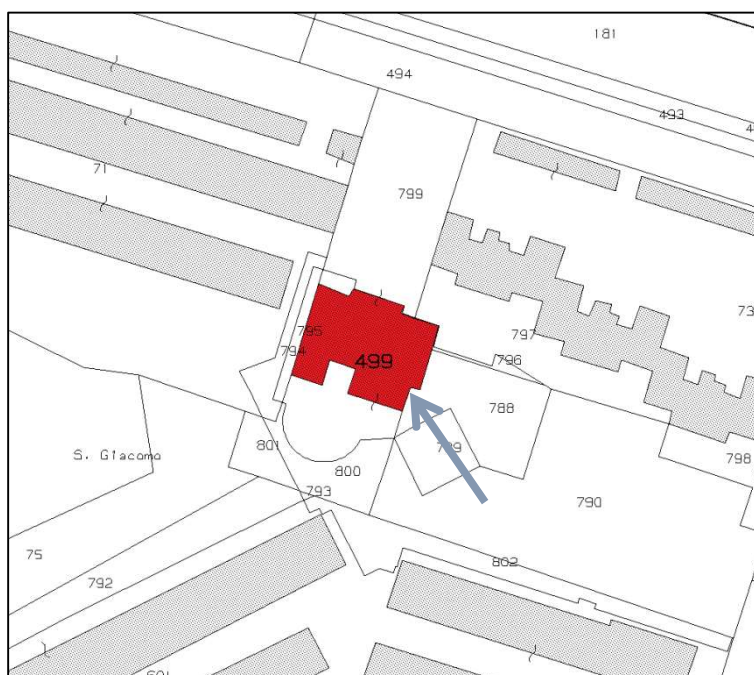
Fig.2 - Estratto di mappa (scala adattata)